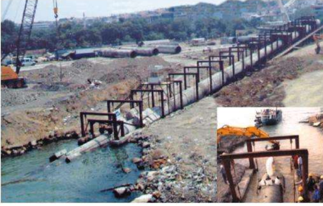
KADIKÖY DENİZ DEŞARJI

Deşarj Hattı: K-67 m + D-2200 m Deşarj Kotu: -51,5 m