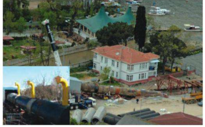
PAŞABAHÇE DENİZ DEŞARJI

Deşarj Hattı: K-67 m + D-2200 m Deşarj Kotu: -51,5 m